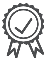
Hohe Qualität und geprüfte Produkte