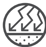
Hohe Haltbarkeit und Belastbarkeit