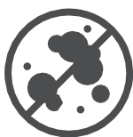
Schimmelbildung wird vermieden