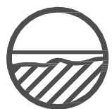
Unebene Oberflächen ausgleichen