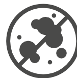
Schimmelbildung wird vermieden