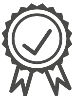
Hohe Qualität und Geprüfte Produkte