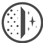
Reguliert das Raumklima